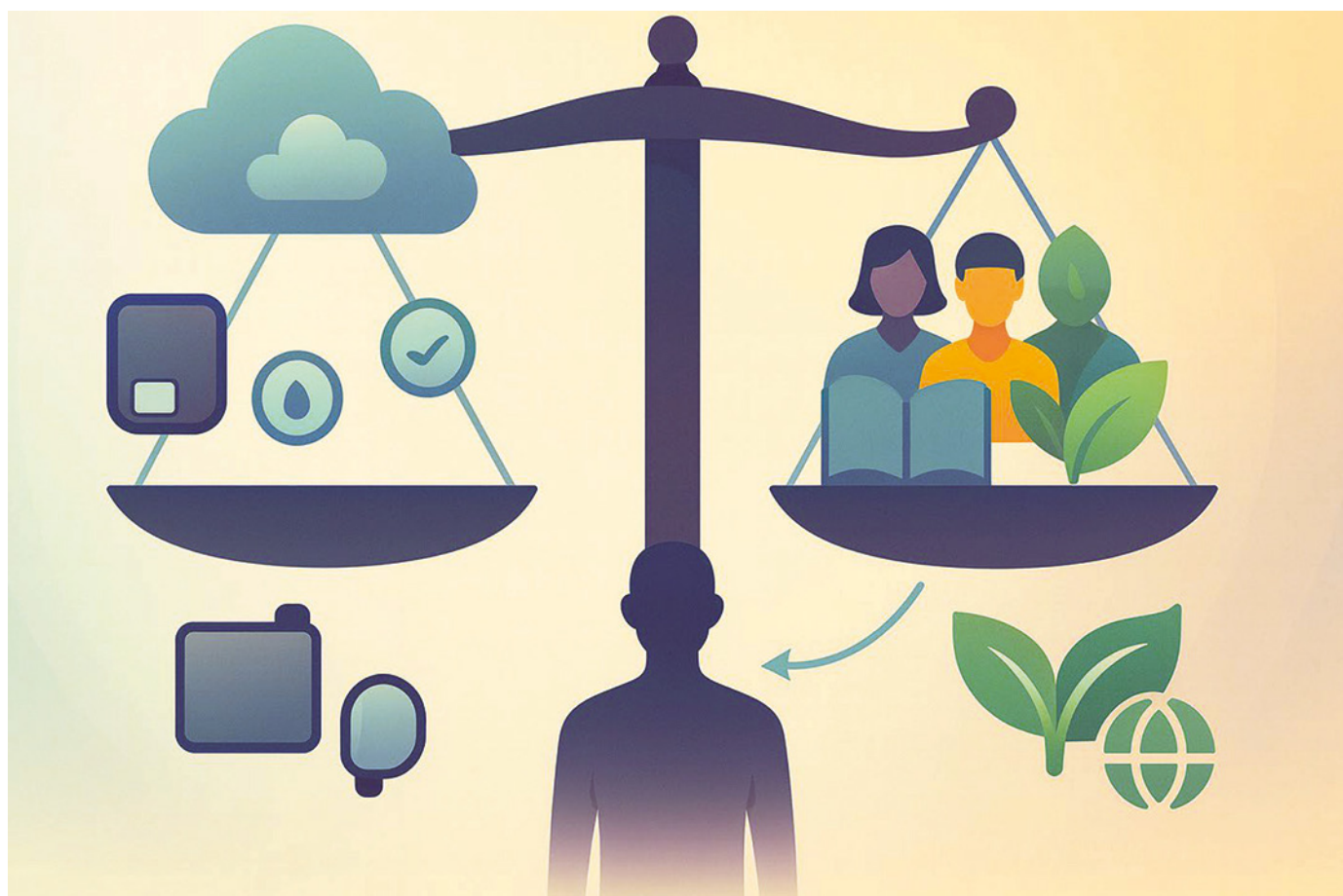
Principales retos para la implementación responsable de la tecnología avanzada en diabetes: equidad en el acceso, formación continuada y sostenibilidad económica y medioambiental.

» ticamente objetivos, alarmas e incluso la estrategia de administración de insulina cuando se detecta cetosis (3,5). Aunque sigue en desarrollo, resume bien la dirección de la monitorización continua en los próximos años: de ver solo la glucosa a disponer de una lectura metabólica más completa y en tiempo real.