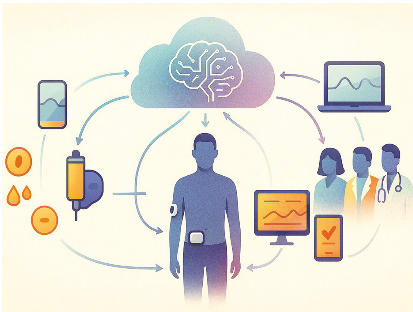
Ecosistema de tecnología aplicada a la diabetes: integración entre bomba, sensores, aplicaciones móviles, plataformas en la nube e interacción con el equipo sanitario.

» nes similares se extiendan a otros ámbitos, como el ajuste de bolos prandiales o la titulación de fármacos no insulínicos.